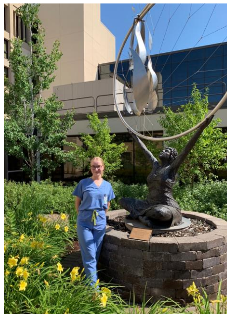
Mercy Hospital Mother Baby Center

Īpaši interesanti bija iespēja redzēt ar da Vinci robotu veiktu totālu histerektomiju.